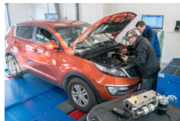
Pripravujeme odborníkov pre automobilový priemysel