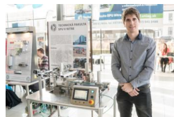
Prezentácia fakulty v Galérii Mlyny