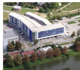
Pohľad na budovu TF SPU