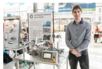
Prezentácia fakulty v Galérii Mlyny