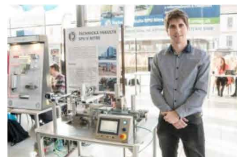
Prezentácia fakulty v Galérii Mlyny