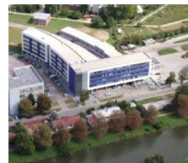
Pohľad na budovu TF SPU