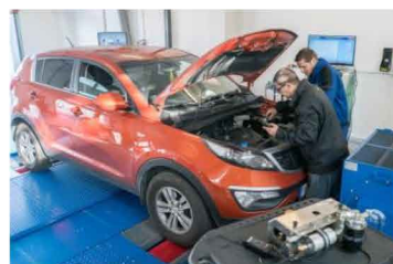
Pripravujeme odborníkov pre automobilový priemysel